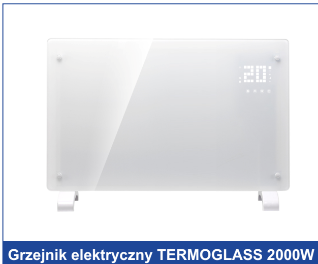
Grzejnik elektryczny TERMOGLASS 2000W