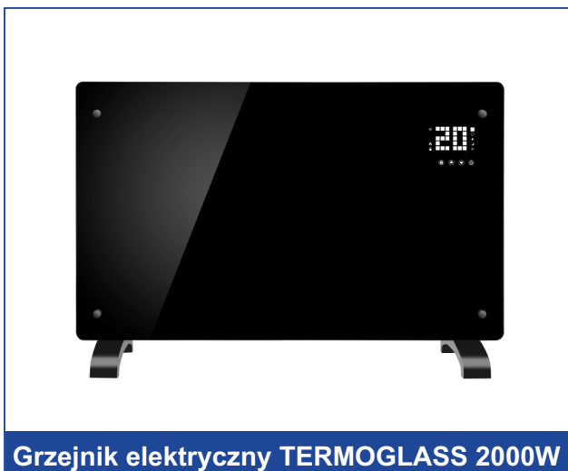
Grzejnik elektryczny TERMOGLASS 2000W