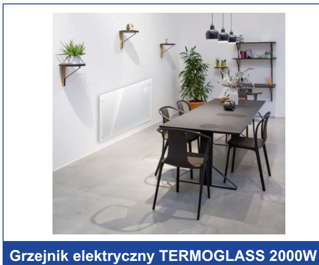
Grzejnik elektryczny TERMOGLASS 2000W